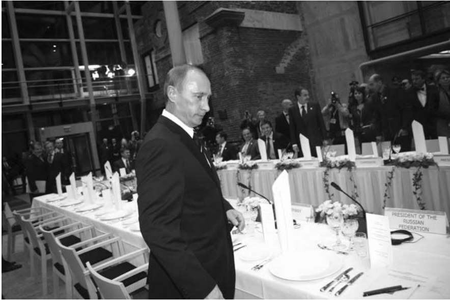
Venäjän presidentti Vladimir Putin etsi tuoliaan ennen Lahden huippukokouksen työpäivällistä 20. lokakuuta.