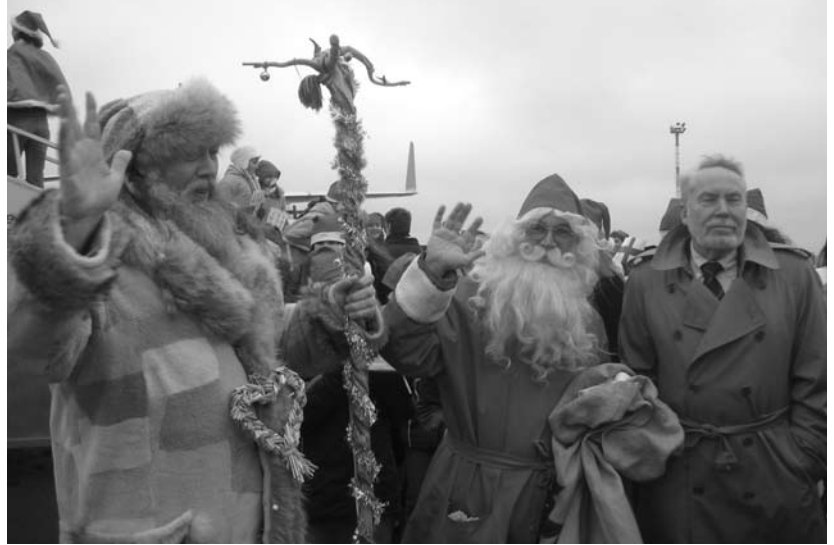
Suomen Joulupukki ja Liettuan Kaledu Senelis sopivat mediamyl- län keskellä varmasti myös tulevan joulun työnjaosta.

Tuskin on montakaan liettua- laista, joka ei tunnista Lordia ja tietäisi, mistä yhtye on kotoisin. Liettuan oma menestys luonnol- lisesti innosti huumorintajuisia liettualaisia pitkään ja kirvoitti suurimpien päivälehtien sivuille komeita otsikoita: "Eurooppa ei kääntänyt selkäänsä euroviisu- jen nousukaille", "Yllätys odotti suomalaisia". Kirjoituksia komi- sivat Lordin ja LT United -yhtyeen kuvat. Liettualaiset muusikot ar- vioivat yhteen ääneen, että euro- viisujen musiikkityylin olikin jo korkea aika muuttua.