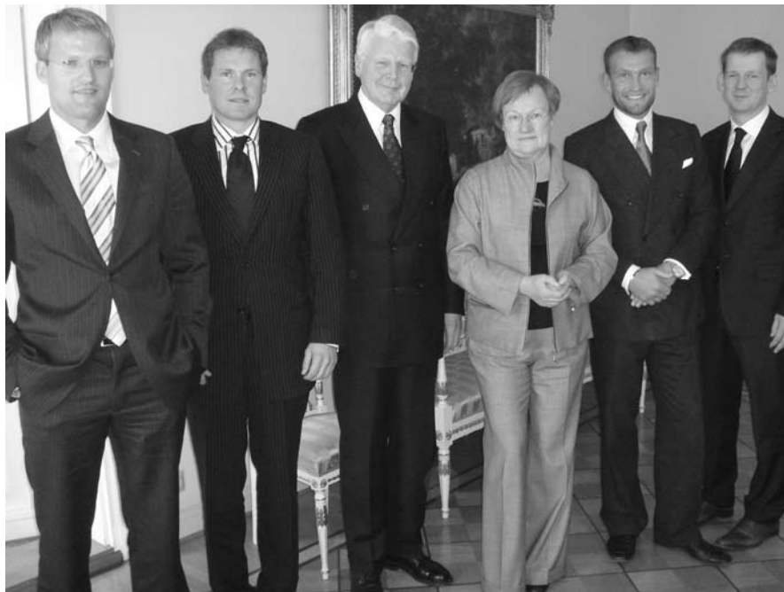
Islannin presidentin Suomen-vierailun valtuuskuntaan kuuluneiden liikemiesten tapaaminen presidentti Tarja Halosen kanssa herätti laajaa huomiota mediassa.

Presidentinvaaleissa tiedotusvälineet toivat melko laajasti esille ehdokkaiden ansiot, taustat ja arviot vaalituloksesta. Sauli Niinistön saama laaja kannatus vaaleissa tulkittiin yllättäväksi, ja tappion arvioitiin johtuneen hänen Nato-kannanotoistaan. Vaalitulosta pidettiin osoituksena presidentti Halosen tekemästä hyvästä ja kan-