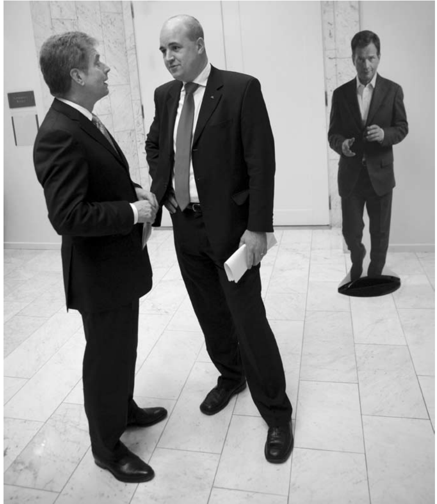
Ruotsin maltillisen kokoomuksen puheenjohtaja Fredrik Reinfeldt tapasi presidentinvaalikampanjaa käyvän kokoomuksen ehdokkaan Sauli Niinistön ja niin sanotun pahvi-Saulin tammikuussa.

Vuoden aikana julkaistiin reportaaseja Suomen kouluista, ja ne liitettiin ruotsalaiseen keskusteluun syvissä vaikeuksissa olevasta koulujärjestelmästä. Suuret lehdet, kuten Dagens Nyheter , Svenska Dagbladet ja Sydsvenska Dagbladet , lähettivät toimittajiaan Suomeen perehtymään Suomen koululaitokseen ja opettajakoulutukseen. Lehdissä julkaistiin hyvin laajoja ja seikkaperäisiä artikkeleita koulukurista, opettajakoulutuksesta, opettajan asemasta, oppilaiden viihtymisestä ja arvossana-asteikosta. Ihmetystä herätti suomalaiskoululaisten varhainen todistusten saanti, sillä ruotsalaiset saavat todistukset ensimmäistä kertaa vasta 8. luokalla.