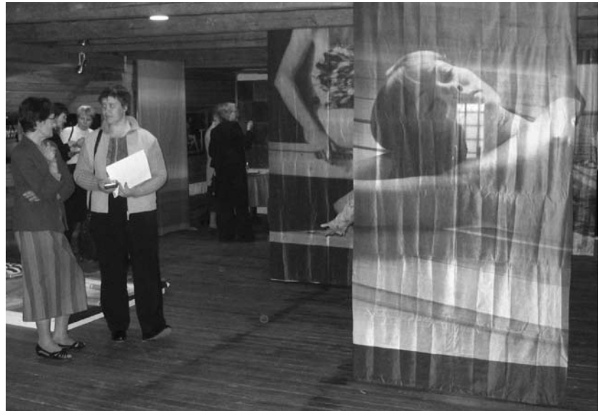
Myös latvialaiset ovat saunakansaa, nähtiin suomalaisen Sauna-näytelyn suosiota Madonan kotiseutumuseossa.

EU-asiat saavat verrattain vähän huomiota Latvian tiedotusvälineissä, keskustelu on laimeaa, ja kiinnostuneiden sekä aiheen tuntevien piiri on pieni. Suomen puheenjohtajuuden näkyvyys oli jonkin verran laajempaa kuin edeltäjien kausina. Keskeisin