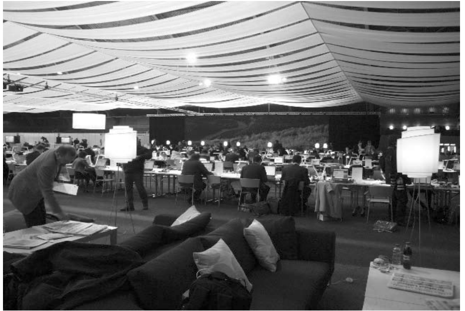
Suomessa vieraili syksyllä lähes sata venäläistä toimittajaa. Lahden epävirallisen huippukokouksen lehdistökeskus oli kaupungin messukeskuksessa.

20. lokakuuta koitti Suomen puheenjohtajakauden yksi merkkipaalu, kun EU-johtajat ja Venäjän presidentti Vladimir Putin kokoontuivat Lahteen EU:n epäviralliseen huippukokoukseen. Ennen epävirallisia neuvotteluja Venäjän tiedotusvälineet kertoivat Suomen pääministerin Vanhasen