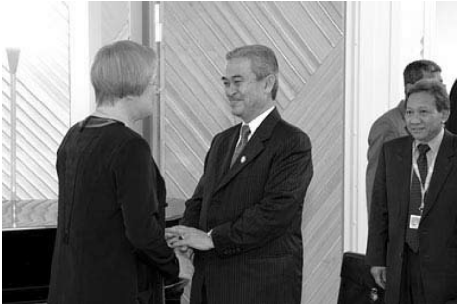
Presidentti Tarja Halonen tapasi Malesian pääministerin Abdullah Ahmad Badawin Mäntyniemessä syyskuussa.

Yleisimmin Suomi esiteltiin Malesiassa eräänlaisena teknologian ja