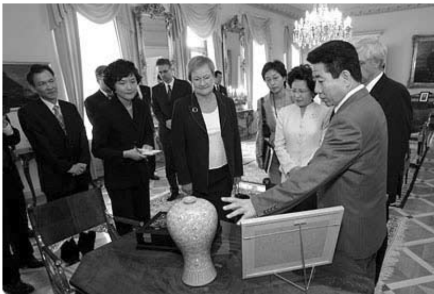
Presidentti Tarja Halonen sai eteläkorealaisen median huomion, kun Korean tasavallan presidentti Roh Moo-hyu vieraili Suomessa Asem-kokouksen yhteydessä syyskuussa.

useassa lehtiartikkelissa, joissa käsiteltiin sen osakkeiden arvoa, voittoastetta tai myyntilukuja. Mutta myös Oulun yliopiston ja Nokian välisestä yhteistyöstä kirjoitettiin huhtikuussa.