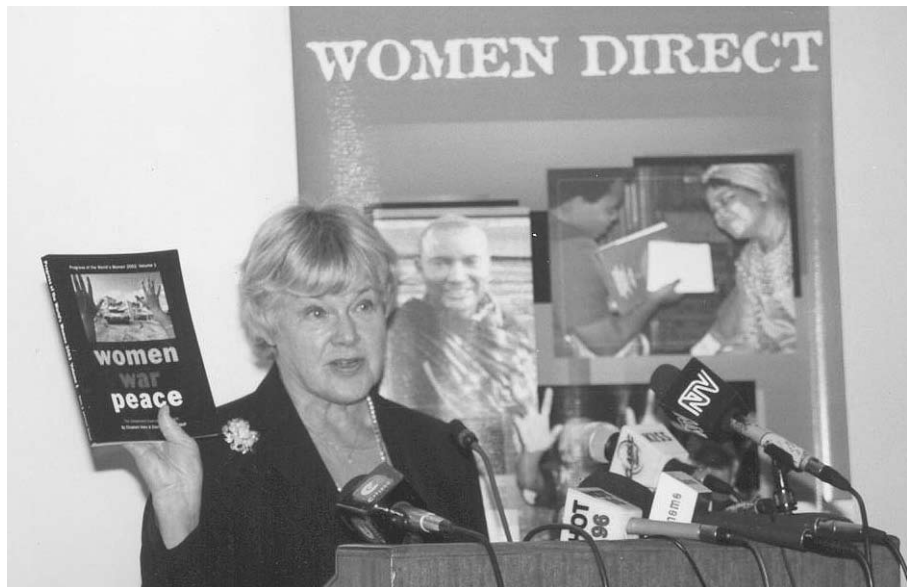
Elisabeth Rehnin Nairobissa kansainvälisessä naiskonferenssissa esittämät ajatukset saivat julkisuutta niin Kenian lehdistössä kuin radiossa ja televisiossakin.

Edustusto päättikin toimittaa Suomen itsenäisyyspäivän kunniaksi maksetun koko aukeaman esittelyn Kenian päälehteen Daily Nationiin . Samassa yhteydessä oli tilaisuus saada julkisuutta edustuston järjestämälle kansainväliselle joulukuussa pidetylle naiskonferenssille, jonka pääpuhujaksi saapui ministeri Elisabeth Rehn . Uutisartikkelin otsikko arvosteli