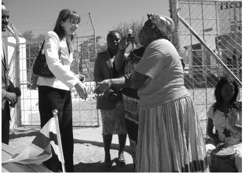
Ulkomaankauppa- ja kehitysministeri Mari Kiviniemi vieraili naisryhmän ylläpitämässä aids-orpokodissa ja soppakeittiössä Windhoekin Katuturassa helmikuussa.

Suomen suurlähetystön muutto, uuden kanslian vihkiminen sekä Suomen itsenäisyyspäivän juhlatilaisuus huomioitiin myös tiedotusvälineissä laajasti. Samalla valotettiin Suomen ja Namibian yhteistyön uudistumista. Lähes kaikki vierailijat, kuten arkkipiispa Jukka Paarma , Suomi-Namibia-seura, monet kansalaisjärjestöt, suomalaiset yhteistyökaupungit Vantaa, Lempäälä ja Kangasala ja suomalaiset kesälukiolaiset, saivat mediajulkisuutta ja ovat osa uutta, monimuotoista vuorovaikutusta. Namibialle ja namibialaisille on hyvin tärkeää, että Suomi on luotettava ystävä, joka ei kehitysyhteistyöohjelman päättyessä jätä