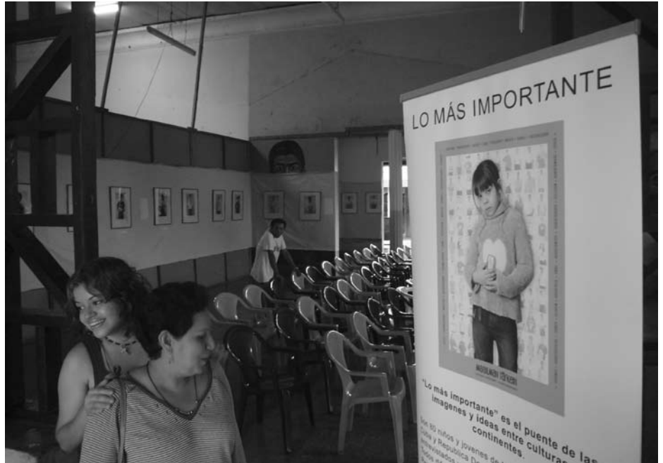
Suomalaisen valokuvanäyttelyn avajaisvalmisteluja Juigalpassa.

Kulttuuriyhteistyö sai suhteellisen paljon julkisuutta vierailevien suomalaisten tanssiryhmien,