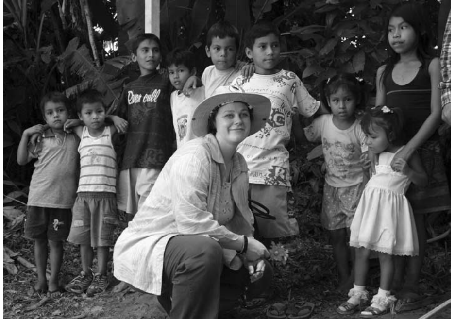
Ulkomaankauppa- ja kehitysministeri Paula Lehtomäki tapasi paikallisia lapsia Amazonin viidakossa Iquitoksessa, jossa Suomi rahoittaa biodiversiteetti-hanketta.