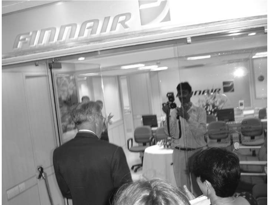
Finnairin New Delhin -toimiston avajaisten myötä aloitetut suorat lennot Helsingistä Delhiin huomattiin Intian tiedotusvälineissä. Kuva: Pirjo Välinoro.

Vuoden jälkipuoliskolla Suomi esiintyi sanomalehtien sivuilla ja televisiokanavien uutisissa tavallista enemmän myös EU-puheenjohtajuuden ansiosta. Vaikka EU ja sen toiminta ovatkin useimmille intialaisille vielä kovin epäselvä