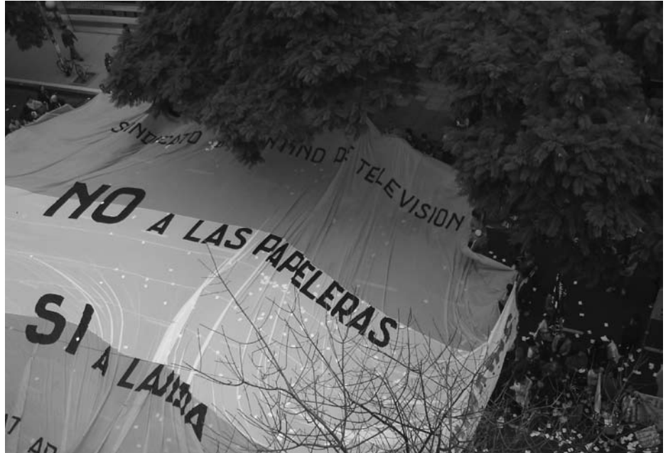
“Ei sellutehtaille, kyllä elämälle.” Yksi Botnian selluloosatehdasta vastustavista mielenosoituksista Suomen Buenos Airesin -suurlähetystön ikkunasta käsin nähtynä.

Suomi oli samanaikaisesti - ja on jo usean vuoden ajan ollut - argentiinalaisissa tiedotusväli-