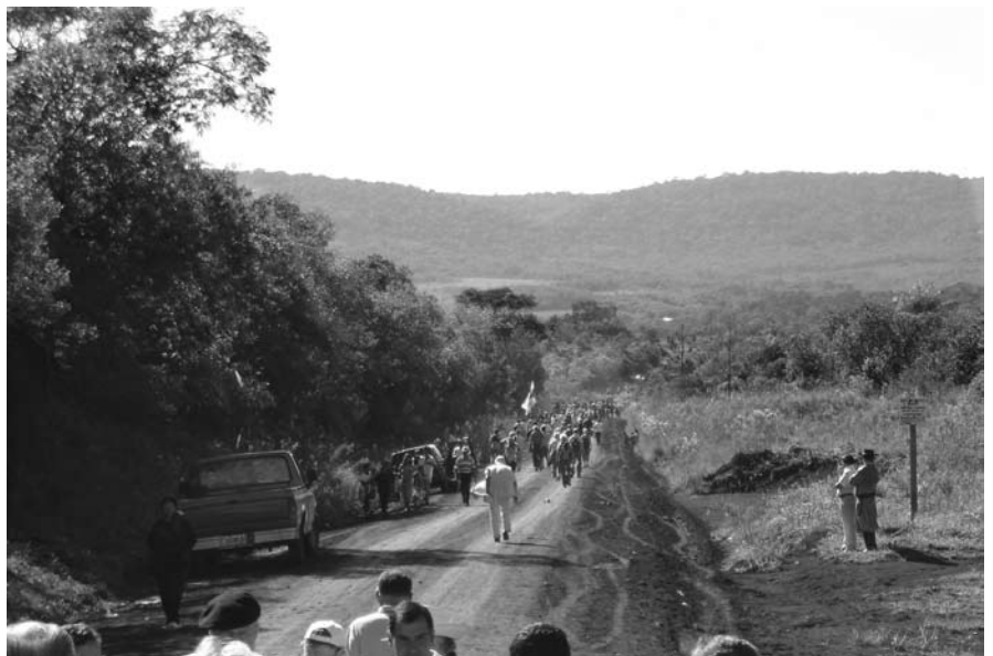
Siirtolaisuuden 100-vuotisjuhlien kävelytapahtuma aloitettiin suomalaisten viidakoon raivaaman Picada Finlandesa -tien alusta. Noin 30 kilometrin varrella on enää aniharva asutettu talo. Suomalaisten siirtolaisten jälkeläiset ovat muuttaneet Colonia Finlandesasta läheiseen Oberán kaupunkiin ja muualle Argentiinaan. Kuva: Suomen suurlähetystö Buenos Airesissa.

tiedotusvälineissä niukasti, mutta kuitenkin aikaisempiin puheenjohtajamaihien verrattuna enemmän. Selluloosakiistan vuoksi Argentiinassa kiinnosti Suomen toiminta EU:n kärjessä. Asia muistettiin mainita esimerkiksi Libanonin kriisin yhteydessä. Eniten palstatilaa puheenjohtaja-aikana saivat Italian lausunnot Suomen tavasta hoitaa puheenjohtajuutta niin sanotun kenkäkiistan yhteydessä, suurlähetystön järjestämä EU-suurlähettiläiden Córdoba-vierailu ja vierailuun liittynyt kilpailukykyseminaari sekä Suomen suurlähettilään ja ulkoasiainsihteerin maan toiseksi suurimman kaupungin paikallismedialle antamat EU- ja Suomi-aiheiset haastattelut. •