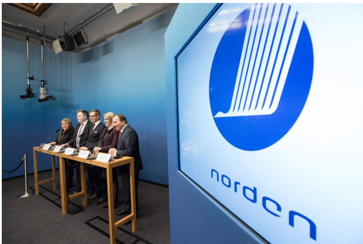
De nordiska statsministrarna i Stockholm i slutet av oktober.

Under diskussionerna på Nordiska rådets session fokuserade statsministrarna på det arktiska samarbetet och Barentssamarbetet, klimatfrågor, FN:s millenniemål samt det nordiska utrikes- och säkerhetspolitiska samarbetet. Med Nordiska rådets presidium och representanterna för självstyrande områden diskuterades bl.a. gränshindersarbetet och de nordiska ländernas internationella strategi för profilering och positionering.