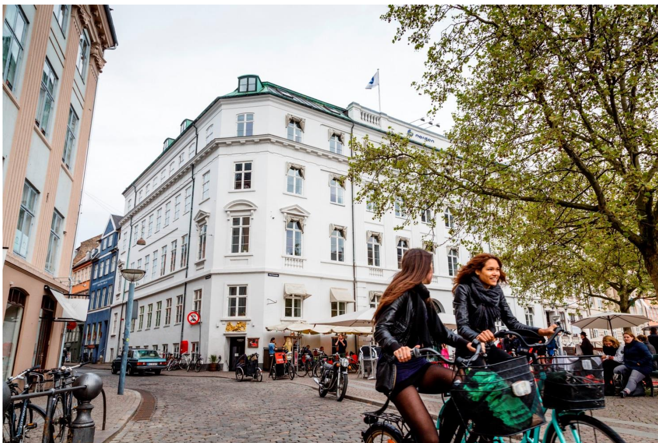
Nordiska ministerrådets byggnad i Köpenhamn på adressen Ved Stranden 18.

Årsberättelsens sammandrag är skrivna av ministerier, organisationer och Sekretariatet för nordiskt samarbete (PYS) vid Utrikesministeriet.