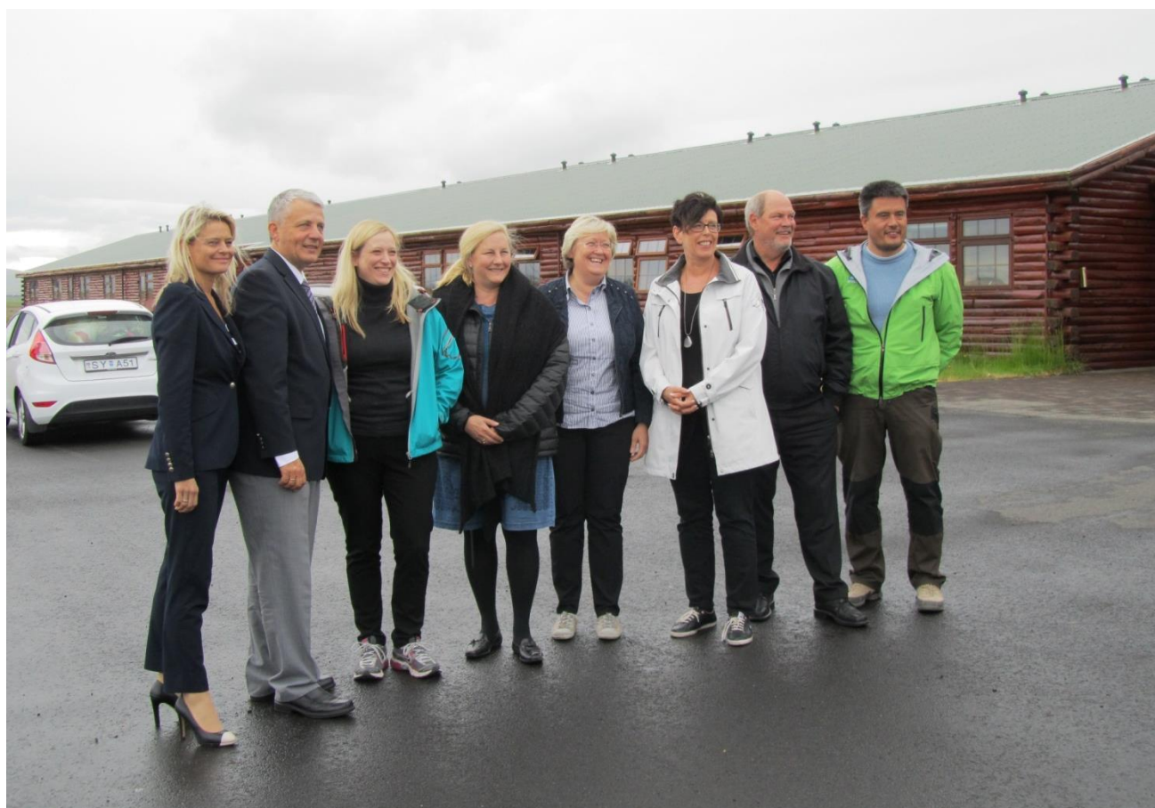
Färöarnas, Islands, Sveriges, Norges, Ålands, Danmarks och Grönlands samarbetsministrar med generalsekreterare Høybråten på södra Island i juni.

Samarbetsminister Toivakka presenterade på Nordiska rådets session ministerrådets redogörelse om EU-samarbetet. Planeringen av Finlands ordförandeskap i Nordiska ministerrådet 2016 började.