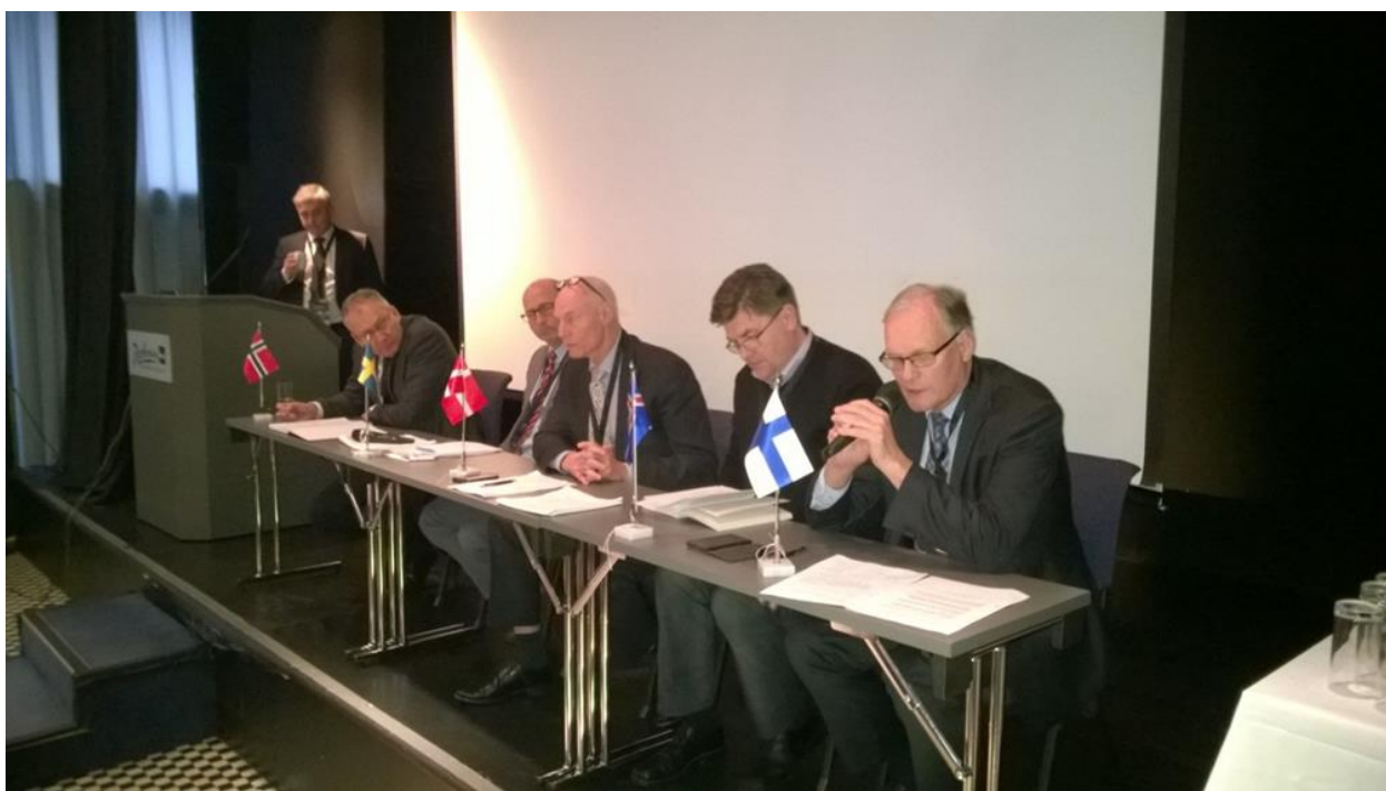
Nordisk poliskonferens den 12 november 2014. Polisöverdirektörernas slutkommentarer.

En nordisk poliskonferens med temat Cyber Crime anordnades i Oslo. Man kom överens om att inleda ett utbildningssamarbete och dessutom diskuterades gemensamma strategier och resursanskaffningar samt gemensam resursanvändning.