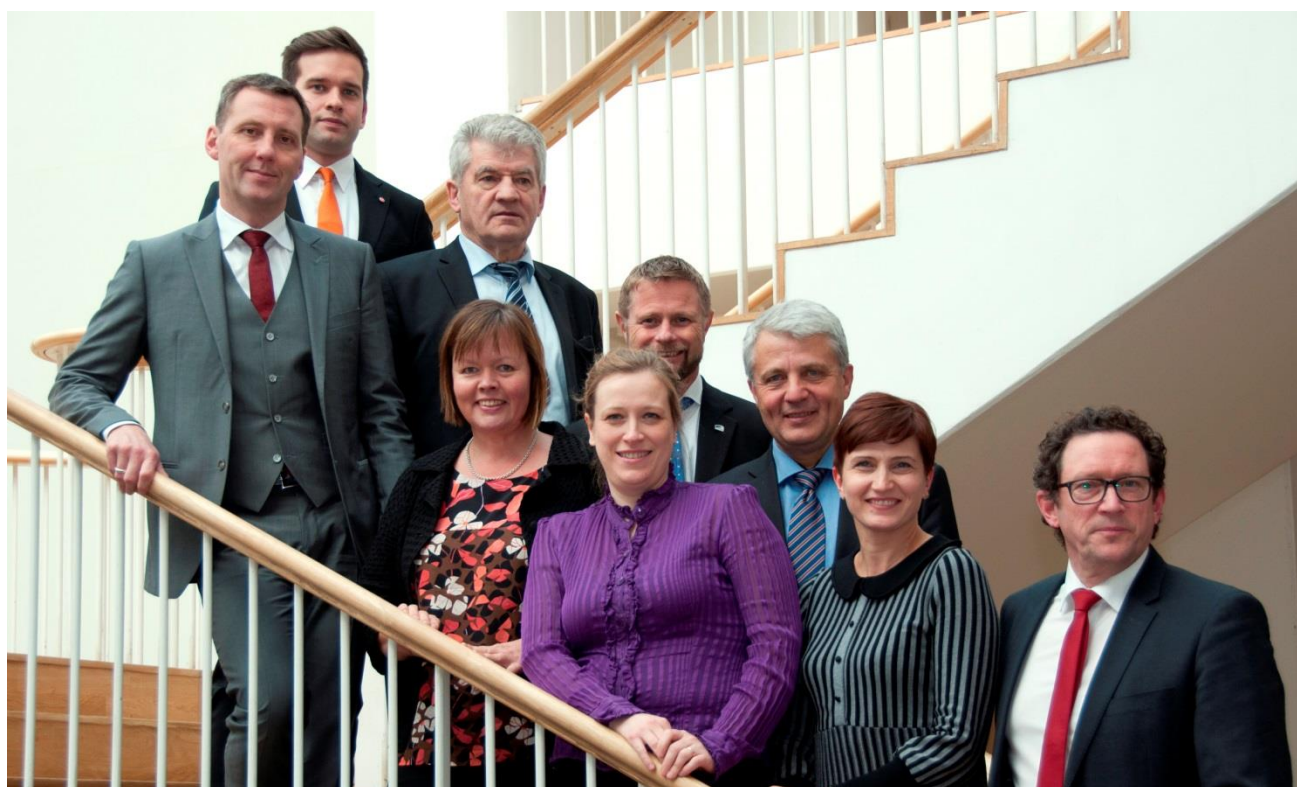
Social- och hälsovårdsministrarna sammanträdde i oktober i Köpenhamn.

Inom Nordiska ministerrådets Hållbara nordiska välfärdsprogram , som gäller för perioden 2013–2015, initieras både samarbete i konkreta insatser samt nordiska plattformar för dialog och kunskapsutbyte med fokus på tre centrala insatsområden inom social hållbarhet i den nordiska välfärdsmodellen; utbildning och arbete för välfärd; forskning för välfärd; infrastruktur för välfärd. Programmet omfattar en rad projekt, till exempel Nordisk välfärdsvakt , ett treårigt projekt under Islands ordförandeskap, välfärdsteknikprojektet CONNECT , samt Socialt entreprenörskap under ledning av Norge.