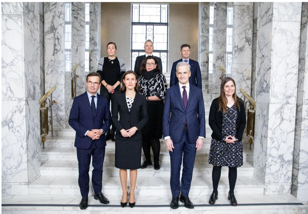
Pohjoismaiset pääministerit eduskunnan marmoriorpotailla istuntoviikolla marraskuussa 2022