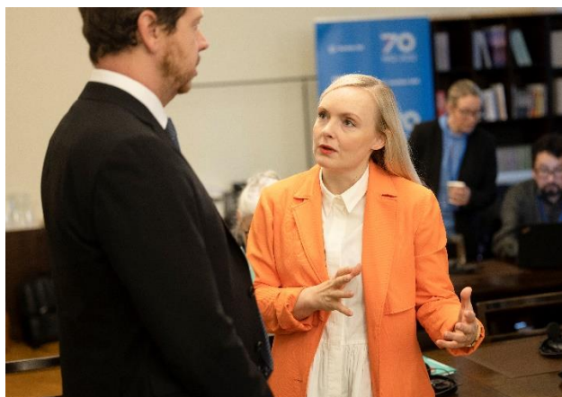
Ympäristöministerit koolla Helsingissä Pohjoismaiden neuvoston istunnon yhteydessä.