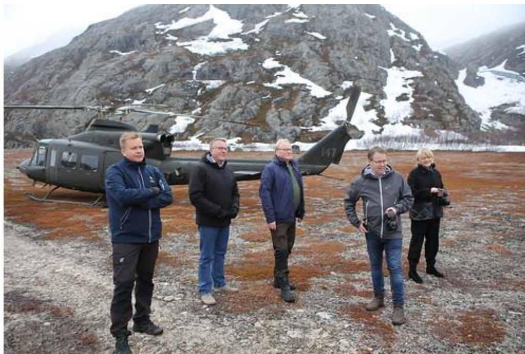
Nordefco puolustusministerien tapaaminen Kirkkoniemessä

Pohjoismaiden puolustusministerit päättivät toukokuun kokouksessaan Norjan Kirkkoniemessä aloittaa uudistustyön, jossa Nordefcon sopeutetaan muuttuneeseen toimintaympäristöön. Uudistustyön suuntaviivoja käsiteltiin syksyn mittaan ja marraskuun kokouksessaan puolustusministerit päättivät, että Nordefcolle laaditaan uusi visioasiakirja, minkä lisäksi yhteistyön rakenteita ja käytäntöjä uudistetaan ja virtaviivaistetaan. Keskeisiä tulevaisuuden yhteistyöalueita ovat esimerkiksi operatiivinen ja suorituskyky-yhteistyö. On tärkeää, että pohjoismainen yhteistyö tulevaisuudessa tukee ja täydentää Natoa. Nordefco nähdään kaikissa maissa hyvänä alustana puolustusyhteistyön kehittämiselle ja työ jatkuu vuonna 2023 Ruotsin puheenjohtajuuskaudella.