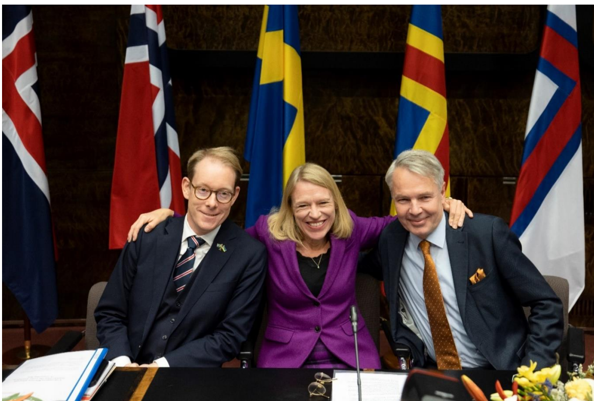
Ruotsin, Norjan ja Suomen ulkoministerit istuntoviikolla Helsingissä marraskuussa

Pohjoismainen yhteistyö YK:n alalla on erityisen näkyvää, esimerkiksi ilmasto- ja tasa-arvokysymyksissä. Norja toimi vuonna 2022 Pohjoismaisen yhteistyön (N5) puheenjohtajana. Vuoden aikana pidettiin useampi virtuaalinen kokous ja ulkoministereiden kesäkokous Bodössä kesäkuussa. Suomi oli vuonna 2022 Pohjoismaiden neuvoston puheenjohtaja, ja syksyn istuntoviikon aikana ulkoministereiden kokous pidettiin Helsingissä marraskuussa. Venäjän laitton hyökkäyssota Ukrainassa on ollut vuoden kokouksien tärkein aihe, mutta myös Natoon liittyvät asiat Suomen ja Ruotsin Nato-jäsenyyslakemusten myötä ovat olleet paljon esillä.