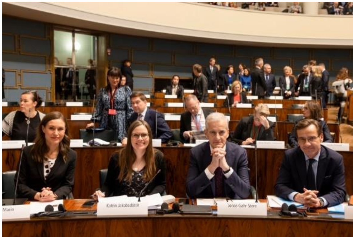
Pohjoismaisia pääministereitä istuntoviikolla Helsingissä marraskuussa 2022