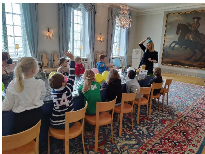
Svenska nu järjesti sanataiteen työpajan kielikylpyoppilaille Ruotsin suurlähetystössä