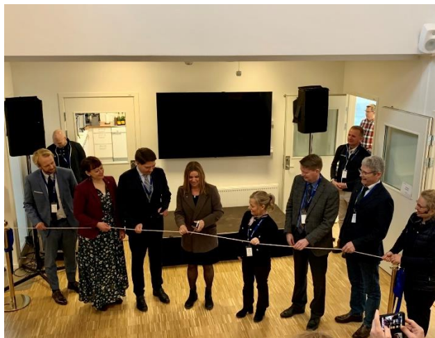
Nordgenin uuden rakennuksen vihkiäiset

Ny Nordisk Mat -ohjelmassa toteutettiin syksyllä hankehakukierros, jonka yhtenä painopisteenä oli lasten ja nuorten ruokakasvatus. Hausta valittiin rahoitettavaksi neljä yhteispohjoismaista hanketta, joiden joukossa Luonnonvarakeskuksen koordinoima Food as Pedagogical Tool –hanke. Suomi nosti NNM -ohjausryhmässä esiin monipuolisesti teemoja muun muassa ilmastoruokaohjelmasta, maatalouden ilmastotavoitteesta ja kouluruokaohjelmasta. MMM osallistui aktiivisesti COP27-ilmastokokouksen Pohjoismaiden paviljongin yhteydessä järjestettyjen pohjoismaisiin ravitsemussuosituksiin sekä maankäyttösektorin ilmastotoimiin liittyvien oheistahtumien toteuttamiseen.