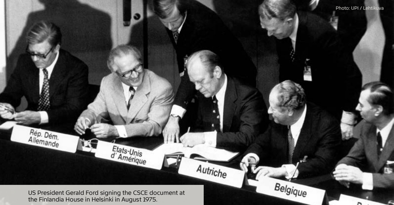
US President Gerald Ford signing the CSCE document at the Finlandia House in Helsinki in August 1975.

Vuonna 1975 allekirjoitettu Helsingin päätösa- kirja oli käännekohta Euroopan turvallisuudelle. Sen myötä 35 valtiota – mukaan lukien kylmän sodan vastapuolet – sitoutuivat yhteisiin periaatteisiin, jotka loivat perustan Euroopan turvallisuusarkkitehtuurille. Näistä periaatteista syntyi ajatus Helsingin hengestä: usko siitä, että Euroopan valtiot voivat ratkaista erimielisyytensä diplomatian keinoin, ei sodilla.